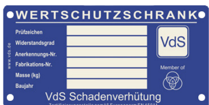
Beispiel Typenschild VdS-Tresore

Sehr geehrter Kunde, bitte bewahren Sie dieses PDF sorgfältig auf. Serienmäßig erhalten Sie mit Ihrem Tresor zwei Doppelschlüssel. Für Ersatz- oder Nachbestellungen verwenden Sie bitte dieses Formular. Bei Tresormodellen mit den hier abgebildeten Typenschildern können aus Sicherheitsgründen Ersatzschlüssel nur nach Vorlage eines Originalschlüssels angefertigt werden. Diese Vorschriften wurden zu Ihrer Sicherheit vom Verband der Schadenversicherer VdS in Köln herausgegeben.