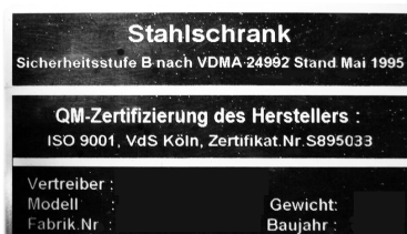
Beispiel Typenschild VDMA-Tresore